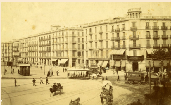
L'Acadèmia des de Pl. Catalunya

Cal tenir en compte que en aquells moments Espanya prohibia a les dones l'accés a l'ensenyament superior, un veto que no es va aixecar completament fins al 1910. L'objectiu era que la dona pogués accedir al mercat laboral i progressar professionalment, deixant de dependre econòmicament de l'home (primer el pare, després el marit). L'acadèmia era, en definitiva, un projecte pioner d'empoderament femení, dirigit per dones i per a les dones.