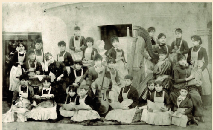
Alumnes de música de l'Acadèmia